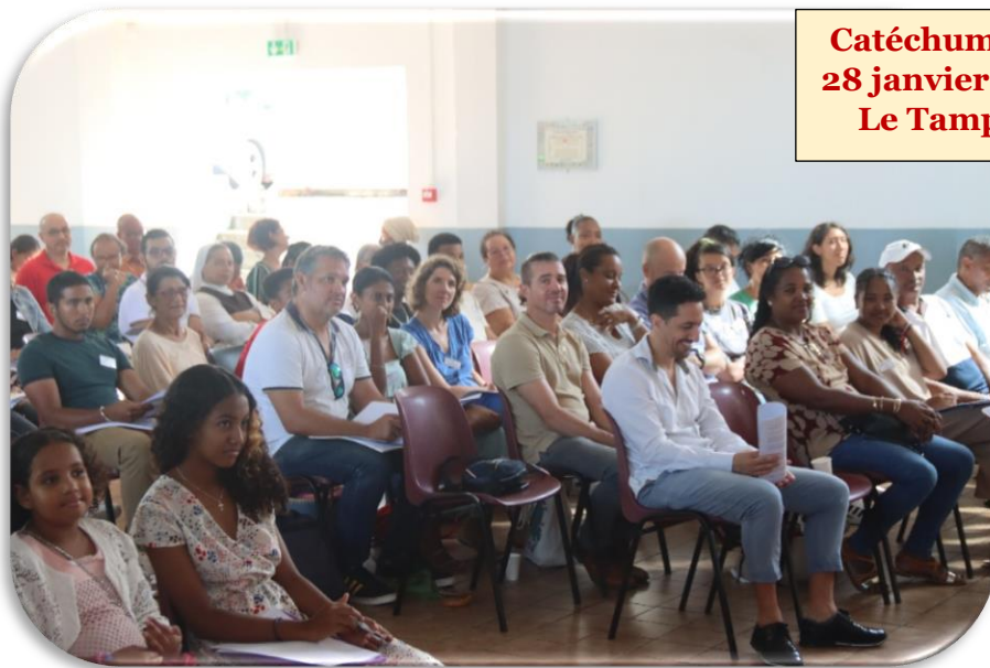
Catéchumènes 28 janvier 2024 Le Tampon

Ce dimanche 28 janvier 2024, près d'une soixantaine de catéchumènes se sont retrouvés au Tampon avec leurs accompagnateurs.